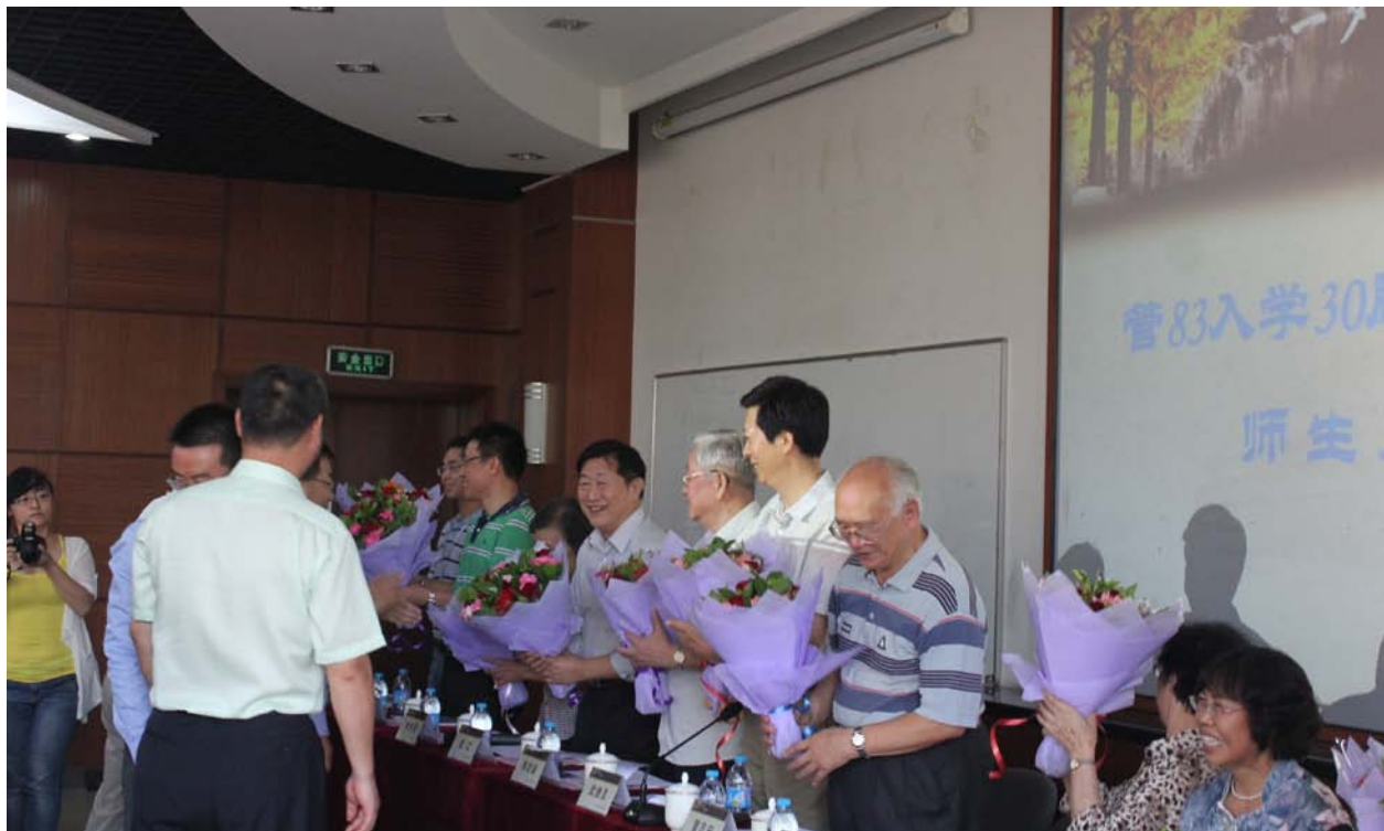
管 83 校友向老师献花