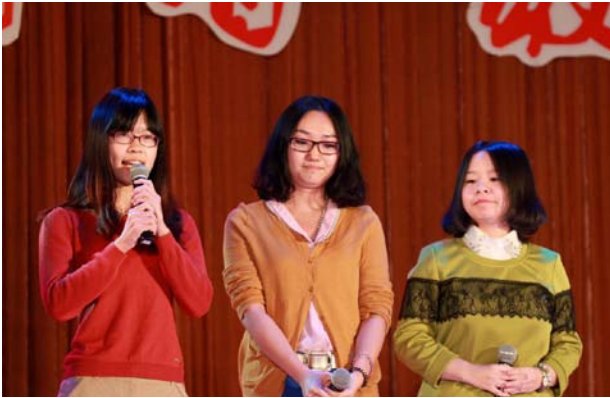
本科 2013 级“小班主任”发言