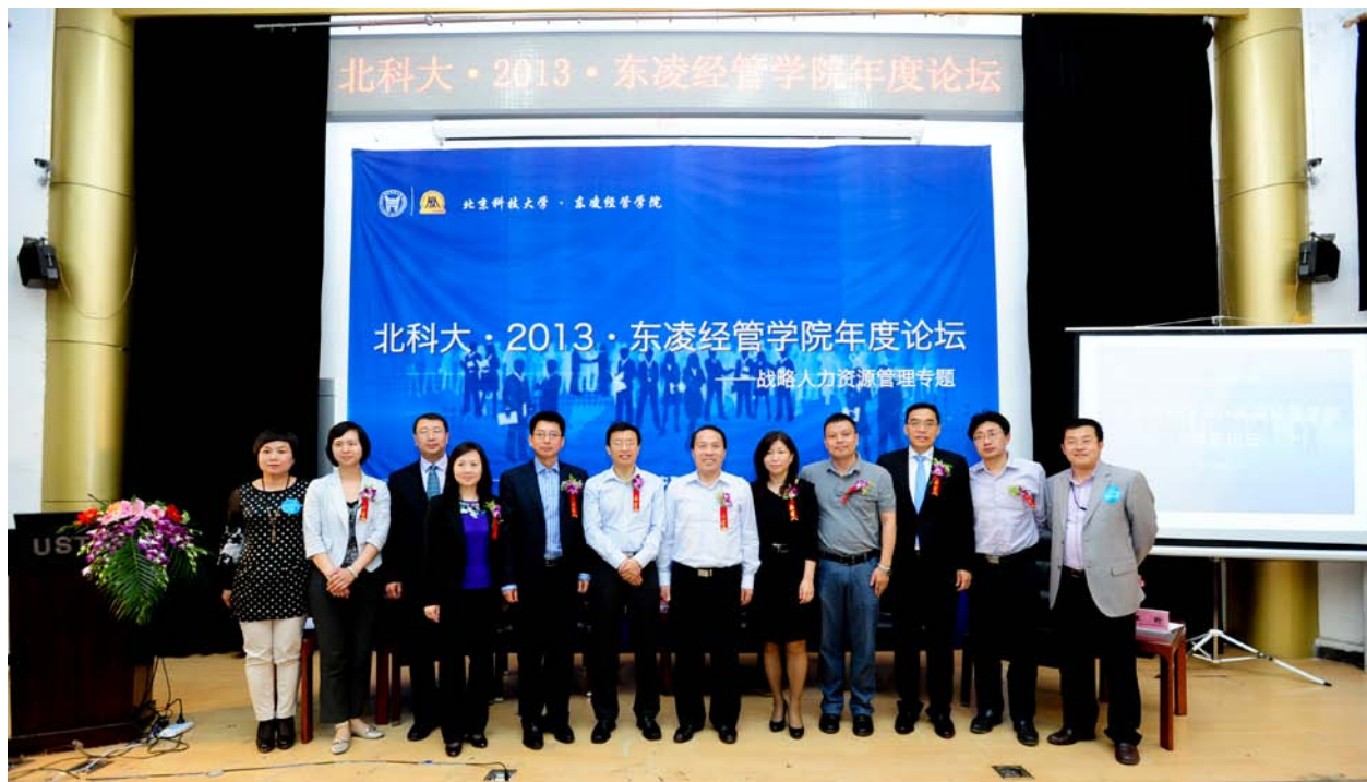
演讲嘉宾与院领导等合影留念