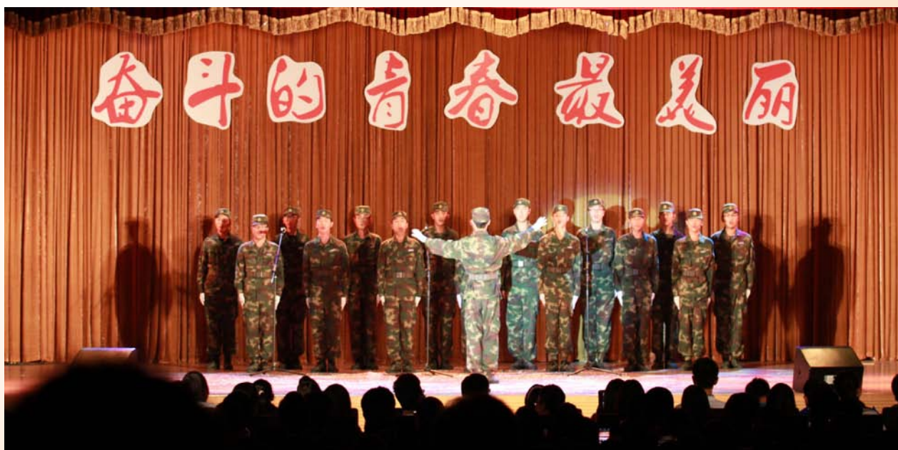
学院首届国防生合唱

本次活动贴近学生需求、富有学院特色，呈现出三大亮点：一是主题响亮，始终围绕“奋斗的青春最美丽”设计环节、节目、