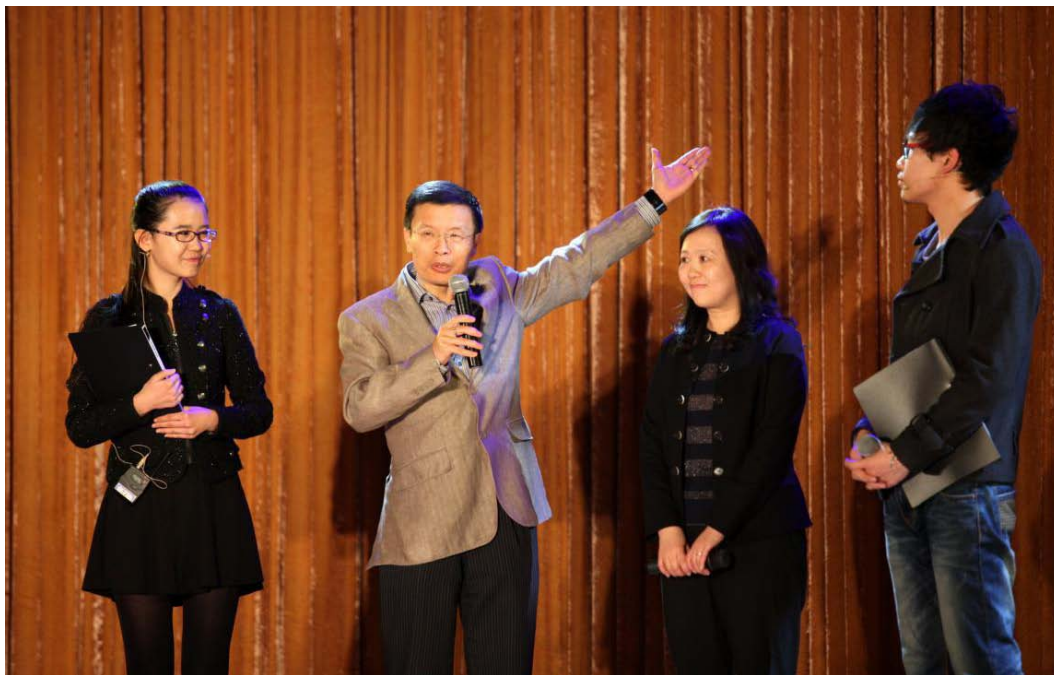
学院领导做主题分享