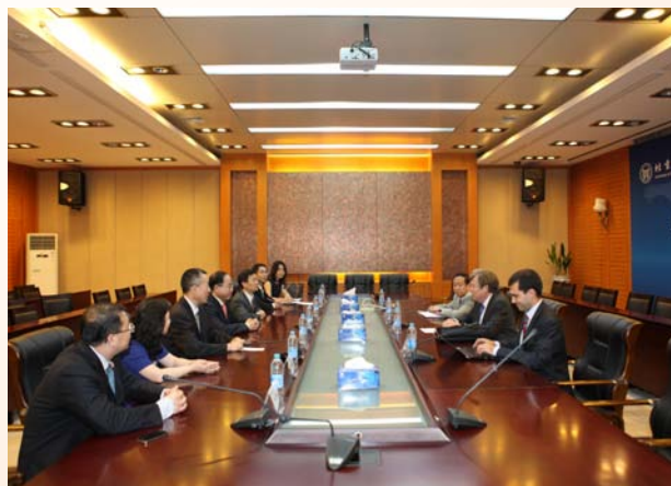
认证专家宣布现场认证意见

AMBA 成立于 1967 年，它与欧洲质量发展认证体系 (EQUIS) 和国际高等商学院协会 (AACSB) 一起被认为是全球最权威的管理学教育国际认证体系之一。AMBA 是专门从事 MBA 质量认证的独立机构，注重体现商务和管理实践的发展。目前 AMBA 认证项目包括 MBA, EMBA, DBA 以及 MBM, 全球共有 211 所商学院获得 AMBA 认证，其中亚洲地区 29 所，中国 (含香港地区) 21 所，北京地区 3 所，分别是中央财经大学、北京理工大学以及北京科技大学。通过 AMBA 国际认证对促进东凌经济管理学院汲取世界先进商