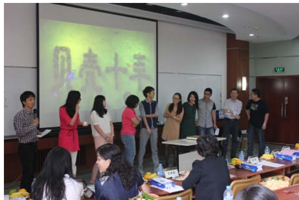
校友逐一讲述毕业后的发展和经历