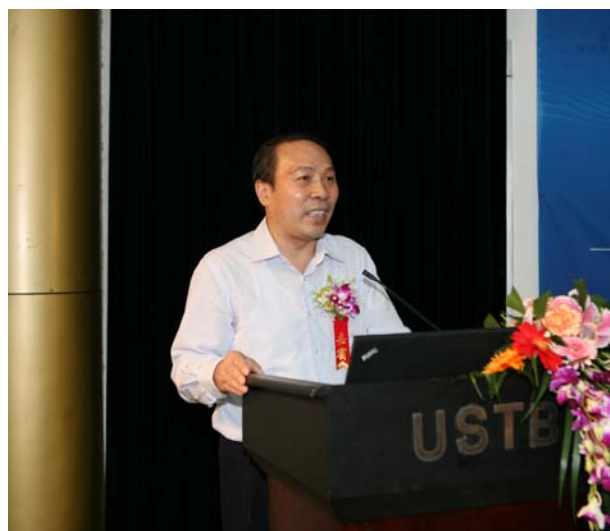
北科大王维才副校长出席活动并 发表讲话