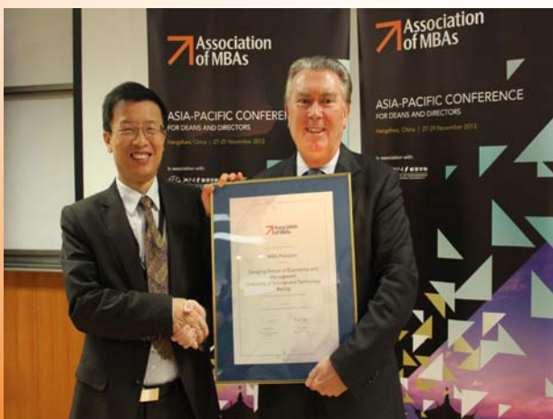
认证专家颁发证书

AMBA的认证的流程是：1、启动阶段，学院向AMBA递交认证申请和意愿书；2、预认证，或者称自我审查，学院向AMBA的IAAB（International Accreditation Advisory Board），即AMBA的国际认证顾问委员会提交自审表，AMBA认证官员来学院进行初步评估；3、正式认证，学院按照AMBA认证标准细则提交详细自审报告，AMBA将派遣认证官员进行实地调查，与校长、院长、教师、学生、校友、雇主分别进行座谈，严审MBA资料；认证官员多是国际知名商学院的院长、国际学者、MBA项目管