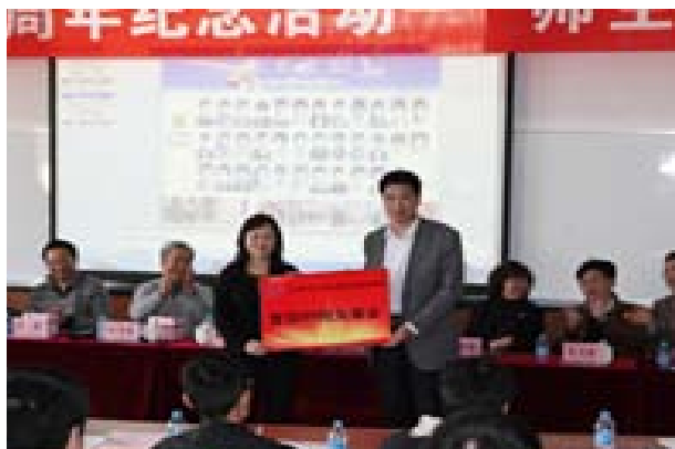
捐赠管信 89 校友基金

2013年4月20日，北京科技大学89级校友毕业20周年庆祝大会在北京科技大学体育馆隆重举行。会后我院管89近30名校友回到学院与院领导和老教师们欢聚一堂，共同纪念毕业二十周年。