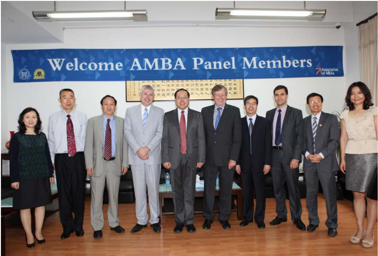
校领导会见认证专家代表团

2013年8月25日，国际MBA协会（Association of MBAs，简称AMBA）正式通知北京科技大学的MBA、EMBA项目获得AMBA国际认证顾问委员会批准，成为中国大陆地区第十八家、北京第三家AMBA认证成员。此次AMBA国际认证得到了校级、