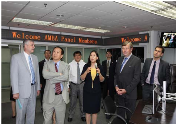
认证专家考察学院实验室

协会 (Association of MBAs, 简称 AMBA) 认证专家抵达北京科技大学东凌经管学院进行 MBA, EMBA 项目的国际认证。在为期三天的现场评估中，认证专家围绕 MBA、EMBA 项目对东凌经济管理学院陈列的相关资料进行了仔细的阅读和研究讨论，分别与学校、学院领导以及项目负责人进行了深入的会谈，并与东凌经济管理学院 MBA、EMBA 项目学生、教师、校友和雇主代表进行了座谈，同时还现场查看了我校图书馆、校史馆、学院金融实验室、学院的北京企业低碳运营战略研究基地、学院图书馆等。