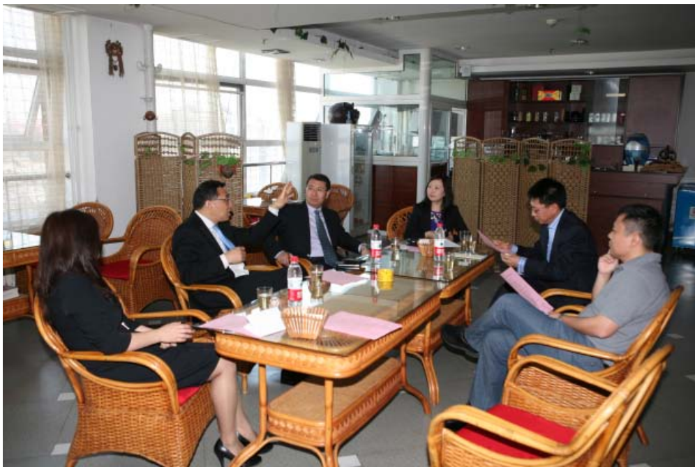
论坛开始前的讨论